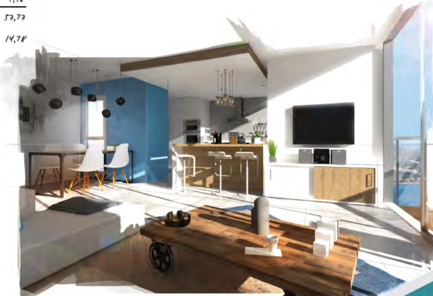
appart. F3 - vue du 15 e étage.